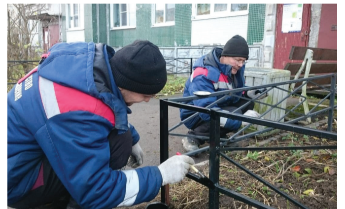
У дома №20 установили новые газонные ограждения и отремонтировали старые.