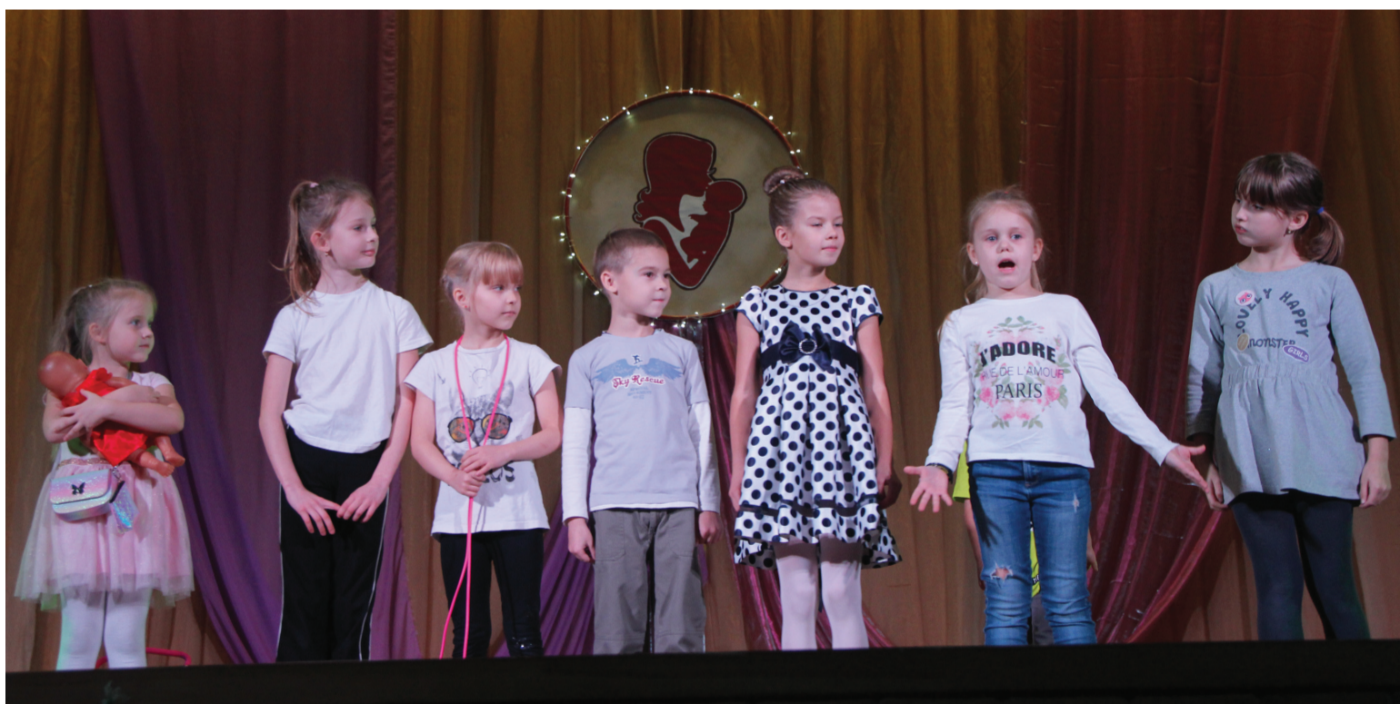
Праздничный концерт в Доме культуры Разбегаево, посвящённый Дню матери, прошёл в онлайн-формате.

Среди многочисленных праздников, отмечаемых в нашей стране, особое место занимает День матери. В последнее воскресенье осени в Доме культуры Разбегаево прошёл праздничный концерт, посвящённый Дню матери.