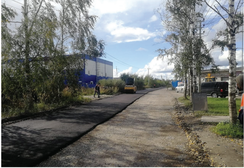
Дорогу Велигенты — Разбегаево — Райкузи отремонтировали.

В сентябре произошло долгожданное событие: дорогу Велигенты — Разбегаево — Райкузи отремонтировали. На участок протяжённостью 1,2 км было потрачено более 8 миллионов рублей.