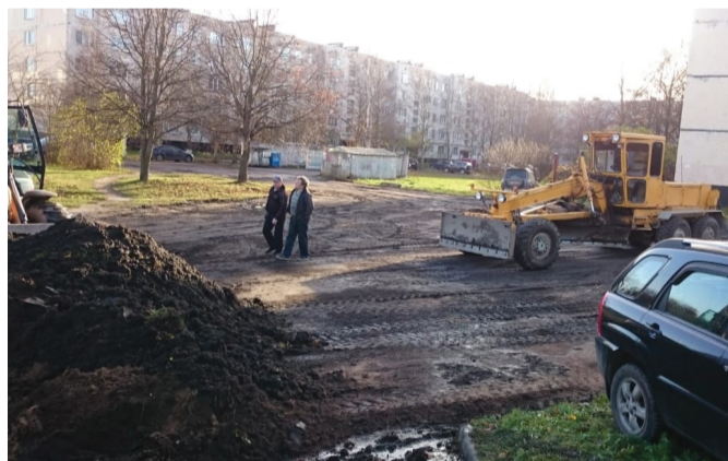
Обустройство территории в створе домов № 9, 21 и 23