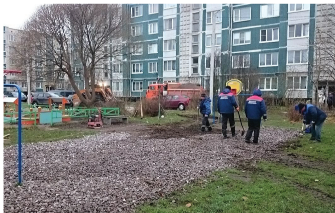
В Горбунках у дома №17 отсыпали спортплощадки.