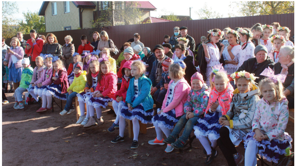
Участники танцевального коллектива «Грация» — дети разных возрастов, некоторые из которых являются жителями деревни Верхняя колония, в ярких, красочных костюмах порадовали зрителей замечательными танцами.