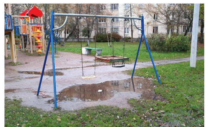
В деревне Разбегаево сотрудники бригады по благоустройству отремонтировали детские качели.