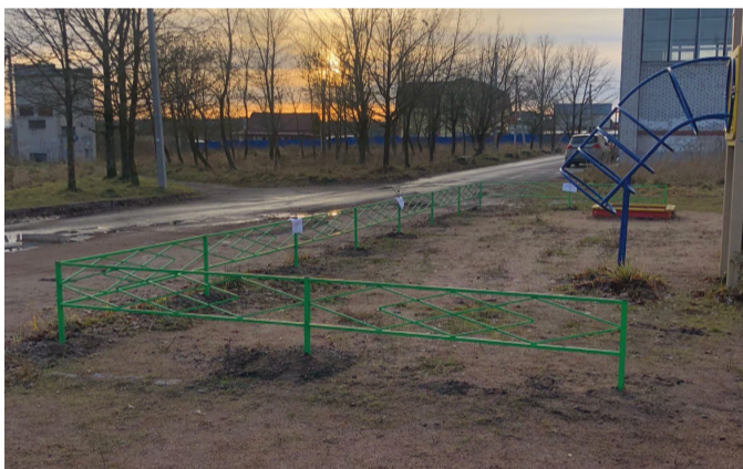
В деревне Разбегаево на детской площадке появилось ограждение.