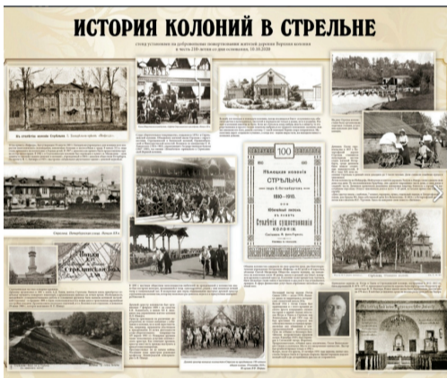
Очень важным объединяющим фактором стало участие жителей деревни в добровольном сборе средств на проведение праздника и изготовление стенда по истории немецких колоний в Стрельне. Теперь узнать историю этих мест может любой желающий!