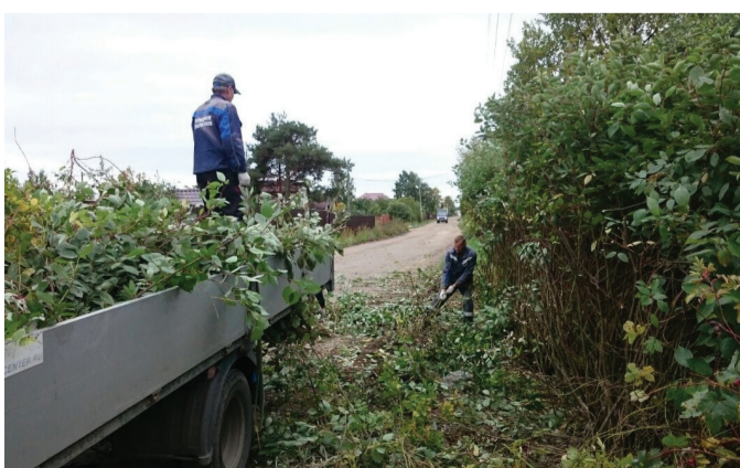
В деревне Верхняя Колония обрезали кустарники, разросшиеся вдоль дорог.