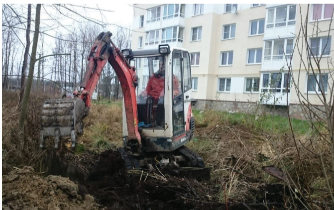
Работы по водоотведению и осушению участка в створе домов №50-52.