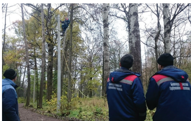
В парке «Беззаботное» убрали упавшие деревья и отремонтировали линии электропередач.