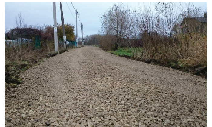
В деревне Старые Заводы подсыпали и выровняли дороги.