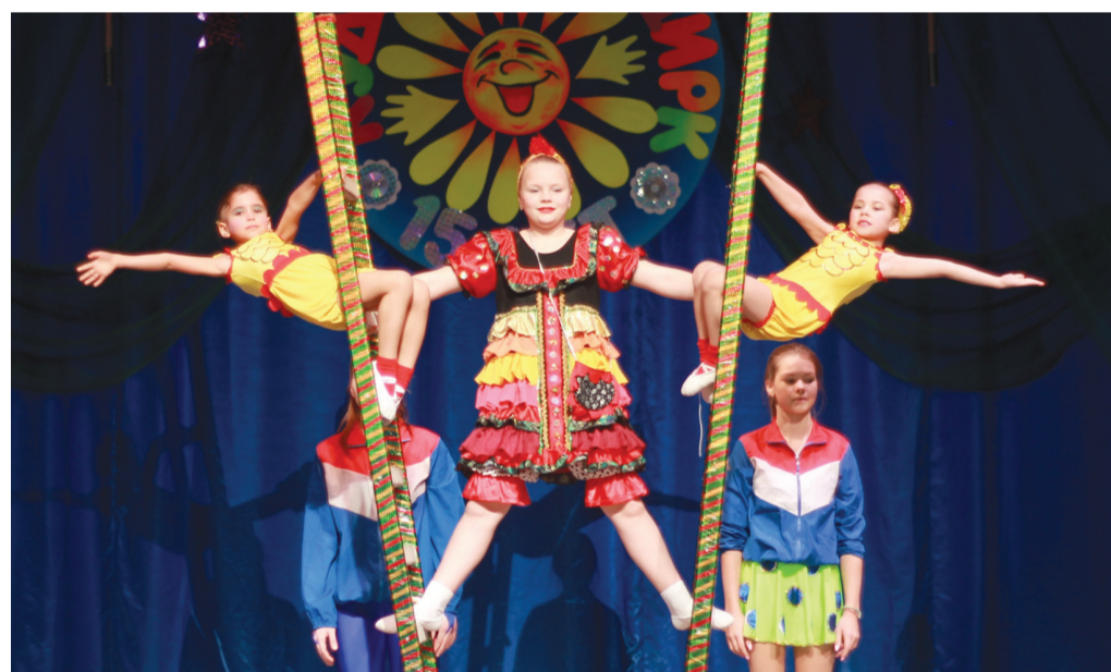
В репертуаре коллектива яркие, красочные цирковые номера. Юные артисты поражают зрителей своим искусством и мастерством.

Сегодня здесь занимаются 25 девочек и мальчишек в возрасте от 5 до 15 лет. В программе коллектива представлены различные жанры циркового искусства: акробатика, эквилибристика, жонглирование, клоунада, воздушная гимнастика и многое другое. Воспитанники цирковой студии ежегодно получают звания на различных областных конкурсах и на фестивалях. В 2019 году ребята завоевали диплом лауреатов I степени в районном конкурсе молодёжного творчества «Дебют», дипломы лауреатов II и III степени, а также Гран-при 13 открытого Российского фестиваля-конкурса циркового искусства «Цветы России» и многие другие награды.