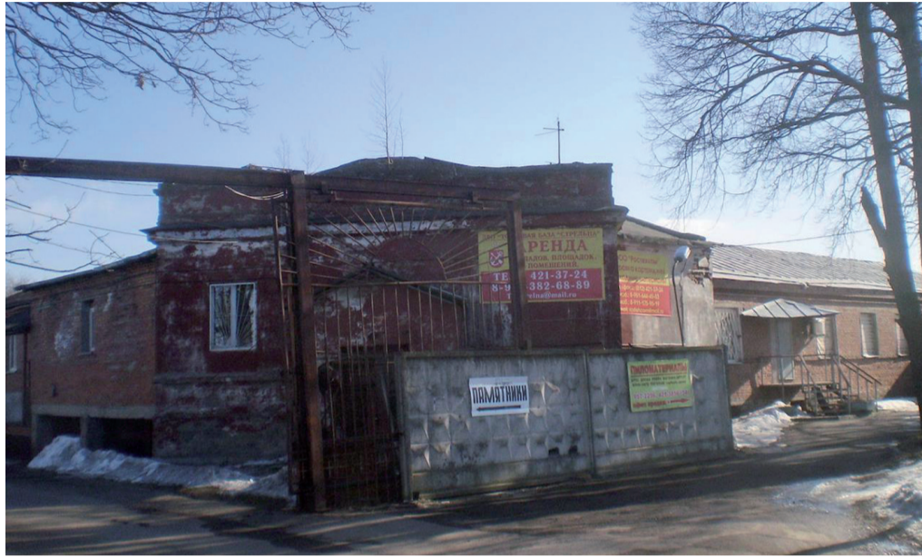
Унылое и неопрятное строение на въезде в Верхнюю Колонию было когда-то величественным зданием в готическом стиле.

«Устав приюта „Вифезда“ был утвержден 19 августа 1891 года. Богадельня учреждалась для женщин всех возрастов евангелического исповедания, неизлечимо больных и неспособных к труду. В начале XX в. сюда стали принимать на воспитание и бедных детей. Евангелическое общество покупает у колонистов несколько десятин земли напротив кирхи и школы. Сооружает двухэтажное деревянное здание по